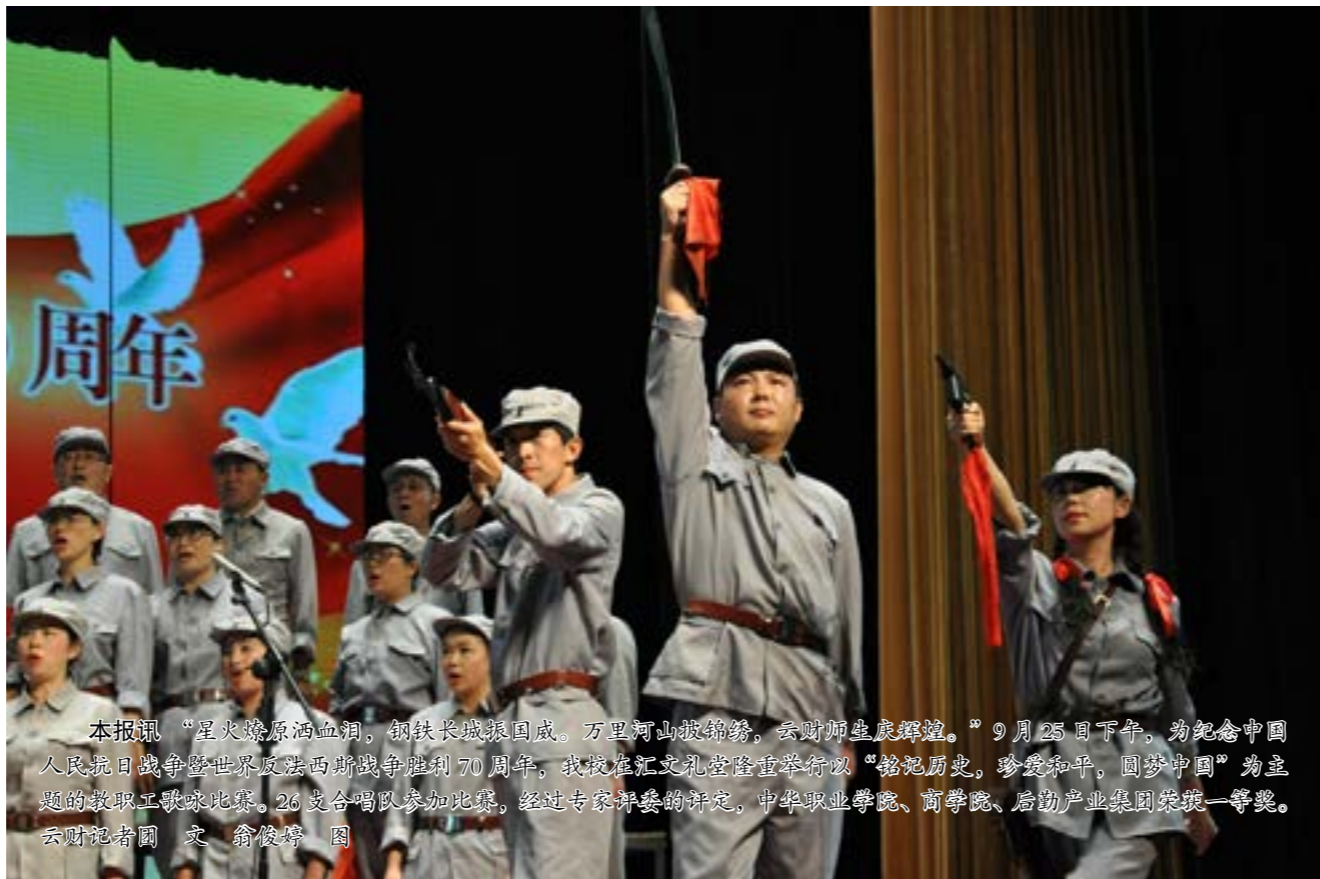
本报讯 “星火燎原血泪，钢铁长城报国情，万里河山报锦绣，天翻地覆慨而慷。”9月25日下午，为纪念中国人民抗日战争暨世界反法西斯战争胜利70周年，我校在汇文礼堂隆重举行以“铭记历史，珍爱和平，圆梦中国”为主题的歌咏比赛。26支合唱队参加比赛，经过专家评审团的评定，中华职业学院、商学院、启渤产业集团荣获一等奖。云财报记者 文 翁俊宇 图

影片《人生不能重来》由中国方正出版社及有关单位联合拍摄，是全国第一部反映贪官落马后其家庭成员凄惨遭遇的反腐倡廉警示教育片。影片内容取材真实案例，视角独特，具有很强的教育意义。该影片不同于一般意义上的故事片、娱乐片，是教育党员领导干部廉洁从政的好教材，释放的是惩恶扬善、警钟长鸣的正能量。通过观看影片，引导广大党员干部进一步增强党性观念，牢固树立廉洁从政理念，切实做到反腐倡廉必须常抓不懈，拒腐防变必须警钟长鸣。纪委办公室